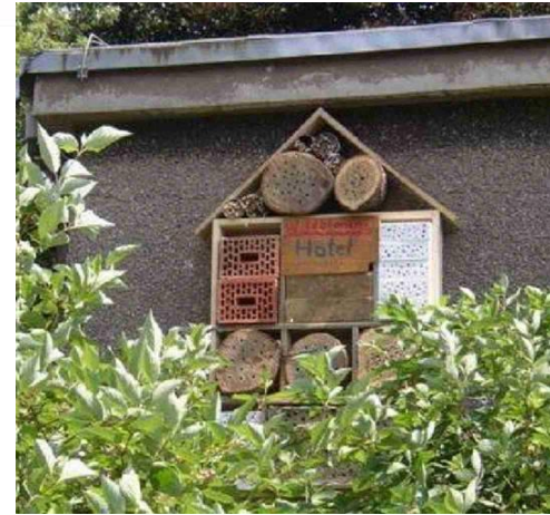
Bienen-Hotel auf dem Schulhof