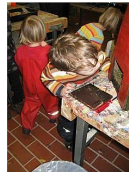
Säubern der Nistkästen im Herbst